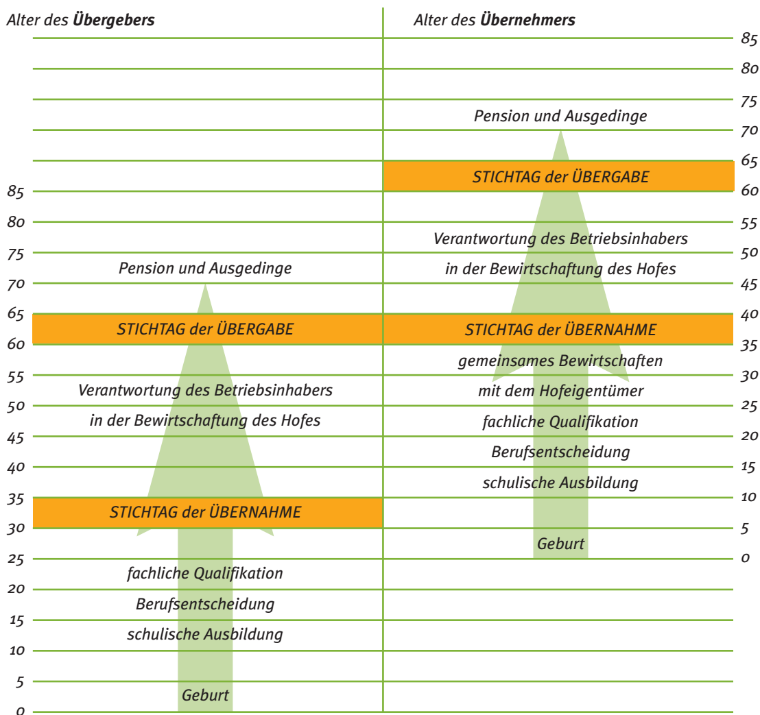
Phasen der Hofübergabe (modellhaft)

Die nachfolgende Darstellung versucht die einzelnen Phasen entsprechend dem Alter modellhaft darzustellen, um die „Dauer“ des Hofübergabeprozesses aufzuzeigen: